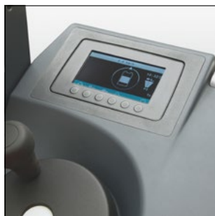
Display del conductor