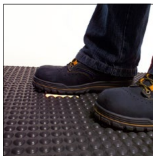
Revestimiento del suelo confortable en toda la plataforma de pie