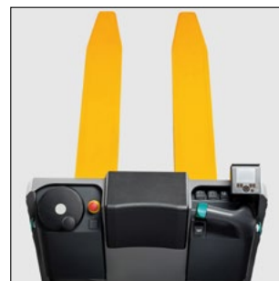
Elementos de mando y pantalla adicional en sentido de carga (opcional)