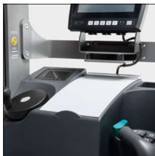
Puesto de trabajo ergonómico