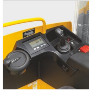
Disposición ergonómica de todas las unidades de mando