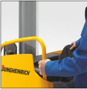
Estribo para un acceso seguro y como soporte para montaje de diversas opciones