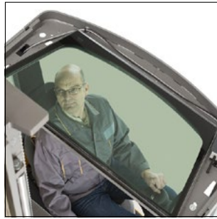
Perfecta visibilidad gracias al tejadillo panorámico