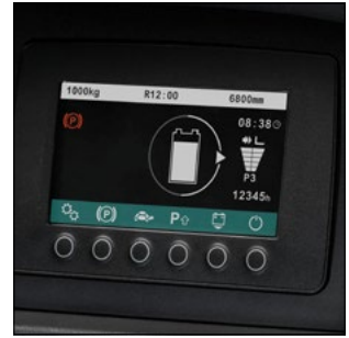
Pantalla de color