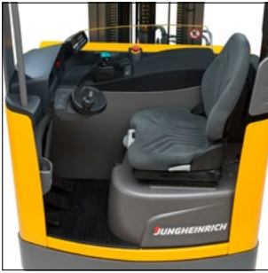
Puesto de mando ergonómico