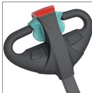
Cabezal de barra timón ergonómico