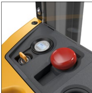
Disposición central de los instrumentos de control