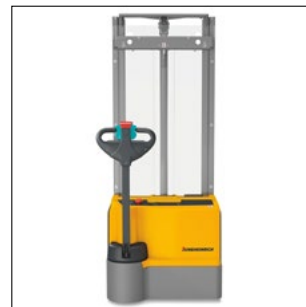
Visión óptima a través del mástil