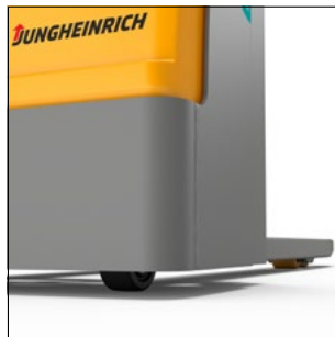
Gran seguridad gracias a un margen con el suelo reducido