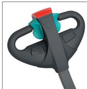
Cabezal ergonómico de la barra timón