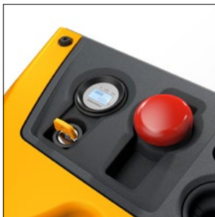
Alineación centralizada de los instrumentos de control