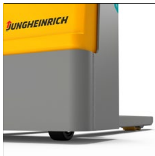
Gran seguridad gracias a una escasa altura con respecto al suelo